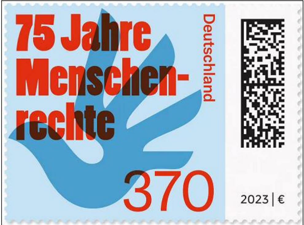
Deutsche Post 2023: 75 jaar Mensenrechten

In 1945 werden de Verenigde Naties opgericht. Een van de doelen was het beschermen van de mensenrechten. Op 10 december 1948 werd in Parijs de Universele Verklaring van de Rechten van de Mens (UVRM) afgekondigd. De Duitse postdienst herdacht deze gebeurtenis op 7 december 2023 met de uitgifte van een postzegel met een geabstraheerde vredesduif.